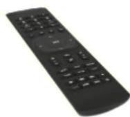
Diaľkové ovládanie 2x AAA batéria