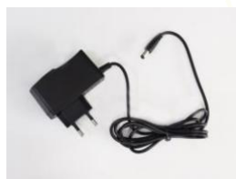
Zdroj, kábel na pripojenie do napájacej siete (230V)